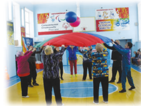
ГУСЬ-ХРУСТАЛЬНОЕ ОТДЕЛЕНИЕ ВСЕРОССИЙСКОГО ОБЩЕСТВА ИНВАЛИДОВ