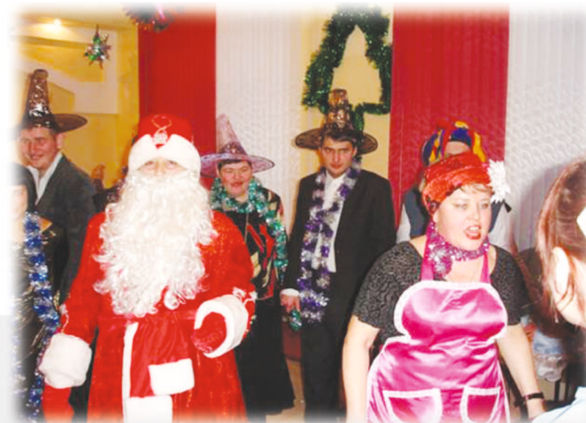
КЛУБ «ХУДОЖЕСТВЕННОЙ САМОДЕЯТЕЛЬНОСТИ» участники которого готовят концерты ко всем знаменательным датам.