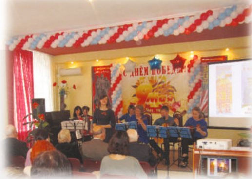
ДЕТСКАЯ ШКОЛА ИСКУССТВ им. М.А. БАЛАКИРЕВА