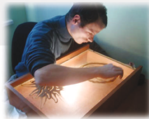
КРУЖОК «ПЕСКОТЕРАПИЯ И ГЛИНОТЕРАПИЯ»