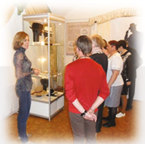
Посещение выставочного зала историко-художественного музея.