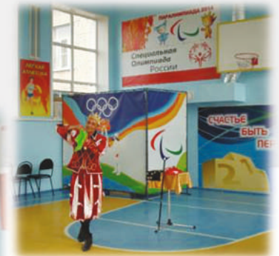
ЦИРК «МАГИК ШОУ» г.КОВРОВ