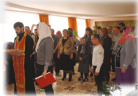
ПРАВОСЛАВНАЯ ГИМНАЗИЯ г. ГУСЬ-ХРУСТАЛЬНЫЙ