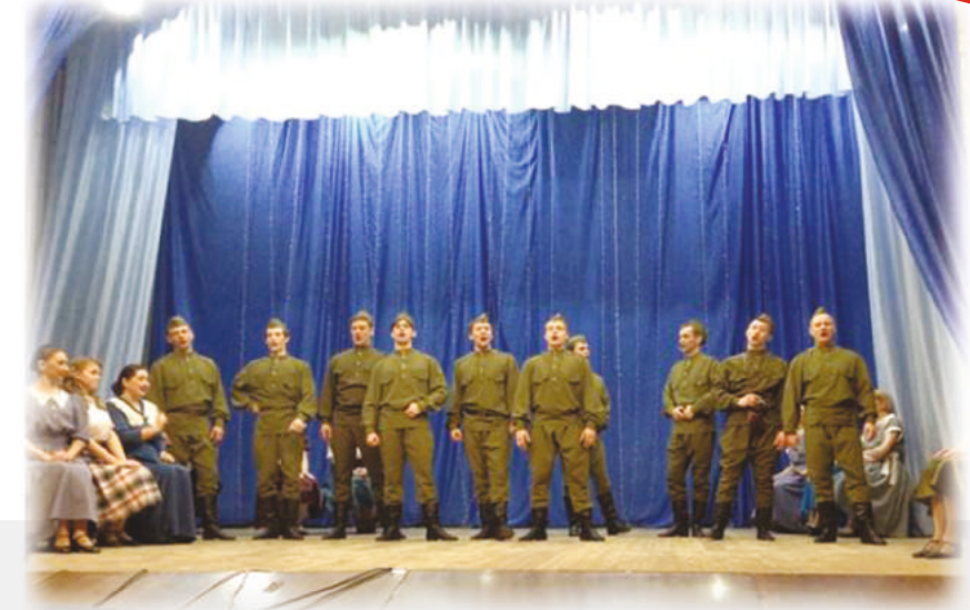
АНСАМБЛЬ «РУСЬ» им. М. ФИРСОВА

Мы с удовольствием посмотрели концерт Государственного вокально-хореографического ансамбля «Русь» им. М. Фирсова, которые выступили со своей программой «От Москвы до Бреста»