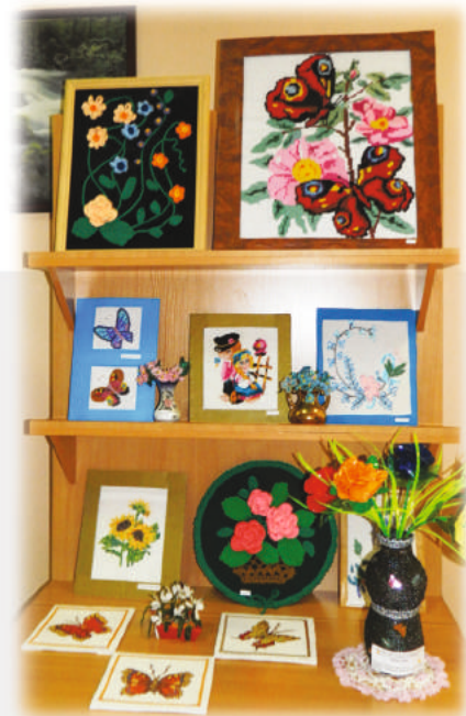
КРУЖОК «УМЕЛЫЕ РУКИ»